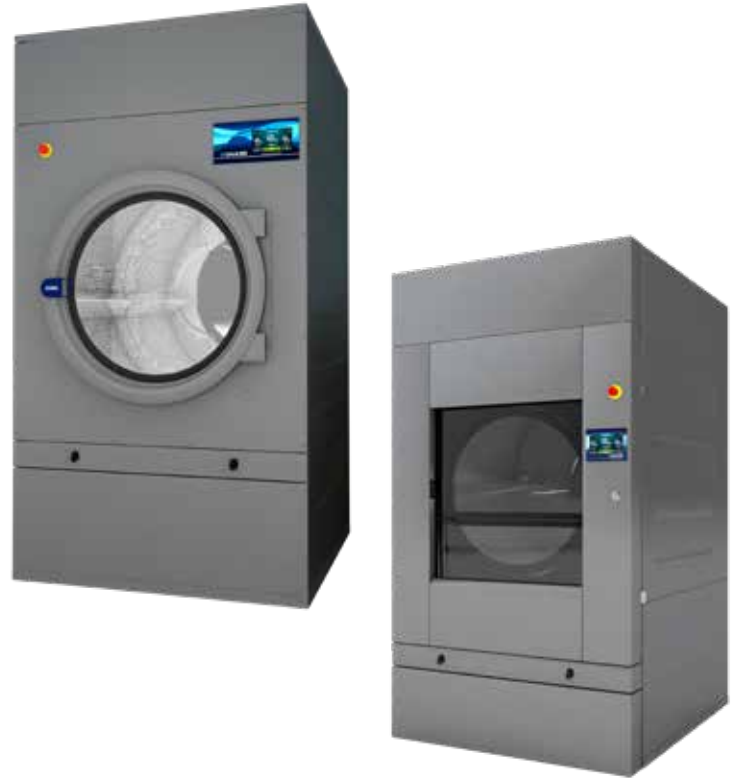
Puerta automática de guillotina

Batería vapor en acero inox (presión hasta 15 bar) Mueble skinplate gris, efecto inox. SOFT DRY - Tambor con perforaciones embutidas. COOL DOWN - Enfriamiento al final del ciclo. Disponibles en calefacción eléctrica, gas o vapor. CE aprobado